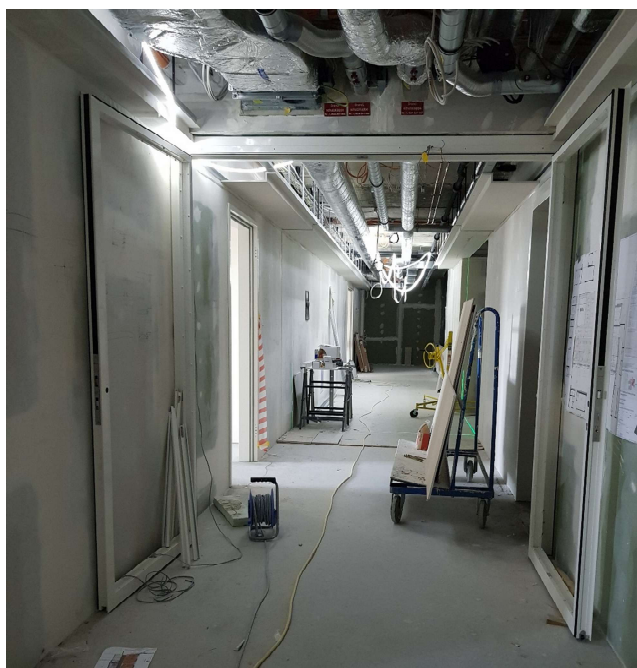
Flur im 2. OG mit einer Glas-Metall-Tür

Die Arbeiten zum 2. Bauabschnitt der Klinik Naila befinden sich im fortgeschriebenen Zeitplan. Die Rohinstallationen für Wasser, Heizung, Lüftung, Medizinische Gase sowie IT, Fernmeldetechnik und Starkstrom sind weitgehend abgeschlossen. Die Wände und Decken sind zum großen Teil fertiggestellt und die Maler haben mit der Beschichtung der Wände begonnen. Etwa die Hälfte der Bodenbeläge sind verlegt und es wurden Türzargen sowie Glas-Metall-Türen in den Fluren eingebaut.