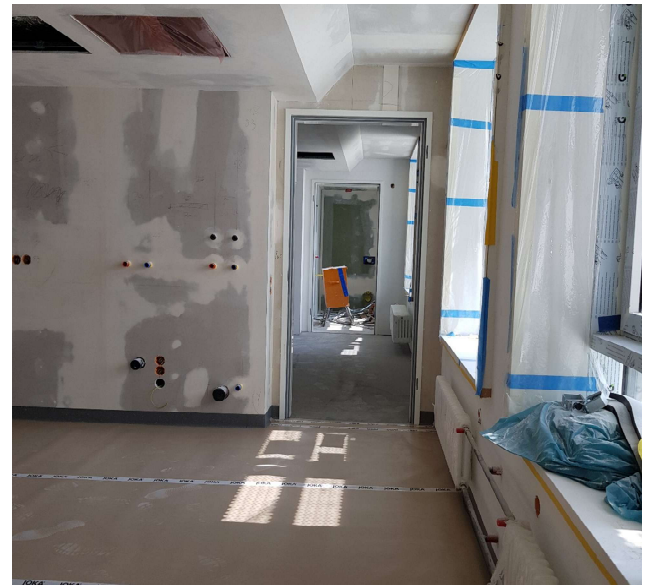
Ein Blick in die Endoskopie

Ab August sollen Türblätter, Einbaumöbel, Laboreinrichtung und die Ausstattung für die Endoskopie geliefert werden.